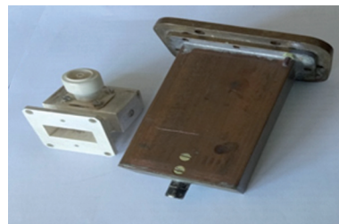
Рис. 1. Зовнішній вигляд ХКЗ: співвісно-торцевого (зліва) і поздовжньо-співвісного (справа)

У загальному випадку хвилеводно-коаксіальні з'єднувачі являють собою комбінований НВЧ-пристрій, реалізований на основі відрізка регулярного хвилеводу та коаксіального роз'єму. Незалежно від габаритів використовуваних коаксіальних з'єднувачів ХКЗ можуть бути двох типів: співвісно-торцеві або поздовжньо-співвісні (рис. 1).